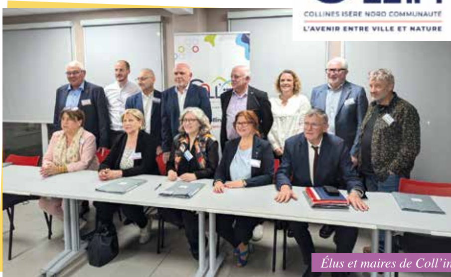
Élus et maires de Coll'in