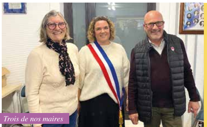
Trois de nos maires

Elle sera également conseillère Sécurité Routière et Conseillère Défense