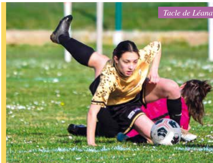
Tacle de Léana

Notre slogan : Parce que les filles le méritent.