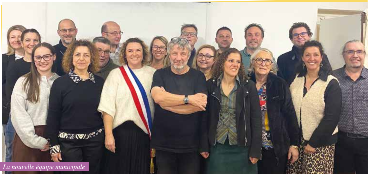
La nouvelle équipe municipale

Les commissions sont en place, pilotées par des adjoints et des conseillers délégués avec parfois l'aide de référent(e)s qui travailleront avec eux en binôme. L'équipe est prête à continuer à œuvrer pour le village en privilégiant l'action et la participation citoyenne. Si l'une de ces commissions vous intéresse, n'hésitez pas à la rejoindre en tant que non élu(e). Contact : direction@charantonnay.fr