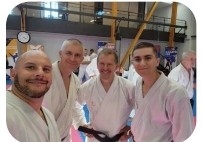
Avec nos partenaires du club de Pusignan.