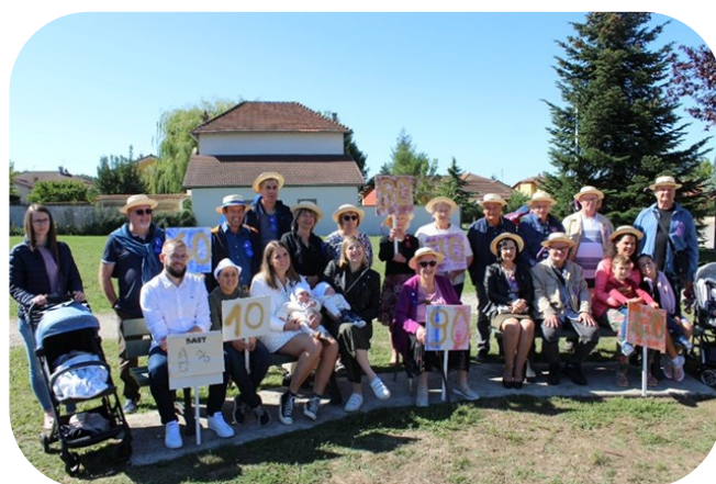
Repas des Classes en 2 le 18 septembre

3 décembre. De nombreux stands vous accueilleront pour que vous puissiez commencer vos cadeaux de Noël. Une dégustation d'huîtres vous sera proposée devant la salle des fêtes. Lors de cette animation, vous pourrez venir chercher tartiflette et/ou choucroute que vous aurez commandée pour participer au Charantéléthon.