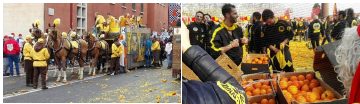
Photo du carnaval d'Ivréa

Certains de nos amis italiens feront également le déplacement pour la fête de la musique et pour Inter-Hameaux du 31 août.