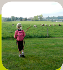
Marche des Collines

Restauration sur place : « La Baraque à Frites » de Oytier St Oblas.